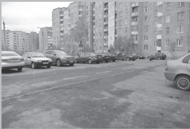
Долгожданная парковка для жителей шестого дома по улице Кондрикова.