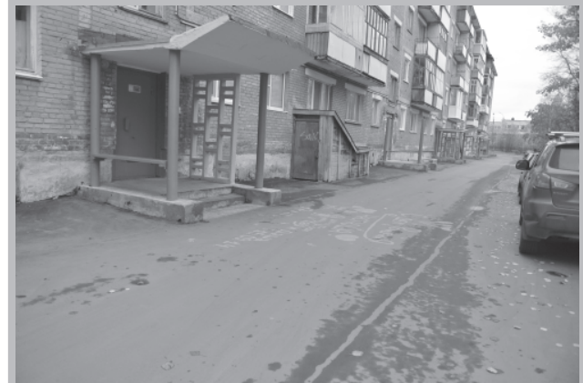
На новом асфальте и надписи появляются только позитивные.

НАДЕЖДА ЛЕОНИДОВНА ТИХОМИРОВА, НАЧАЛЬНИК ПТО УК «ТЕПЛОЭНЕРГОСЕРВИС»: