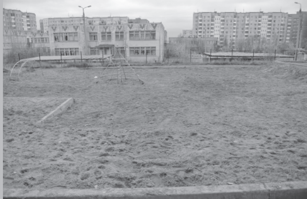
Работы по благоустройству детской миниплощадки уже начались