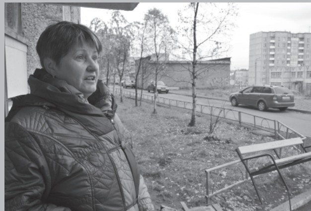
Преображением двора жильцы довольны.