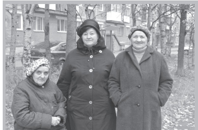
Жильцы домов 66 и 68 по проспекту Metallургов уже забыли об огромных лужах во дворе.

- Асфальт был очень разбитым, лужи стояли огромные, лучше их назвать озерами. А ведь от воды вред не только в том, что не пройти, она размывает фундамент, попадает в подвалы. Теперь дело другое - и ходить красота, и детишки на роликах катаются.